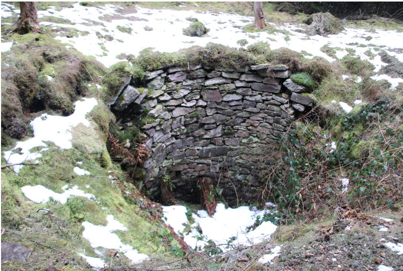
Wolfskaut bei Seibersbach (2017)