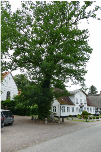
Kaisereiche mit Gedenkstein in Sieseby (2018)