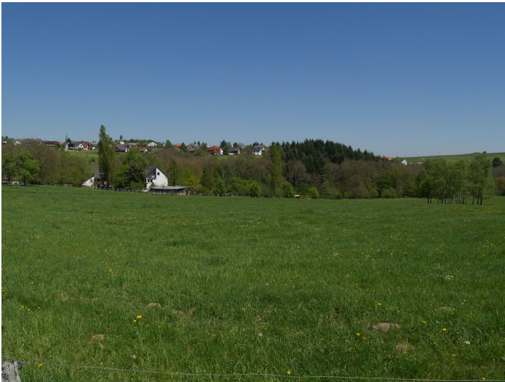
Grünlandflächen bei der Lehmühle bei Schöneberg (2017)