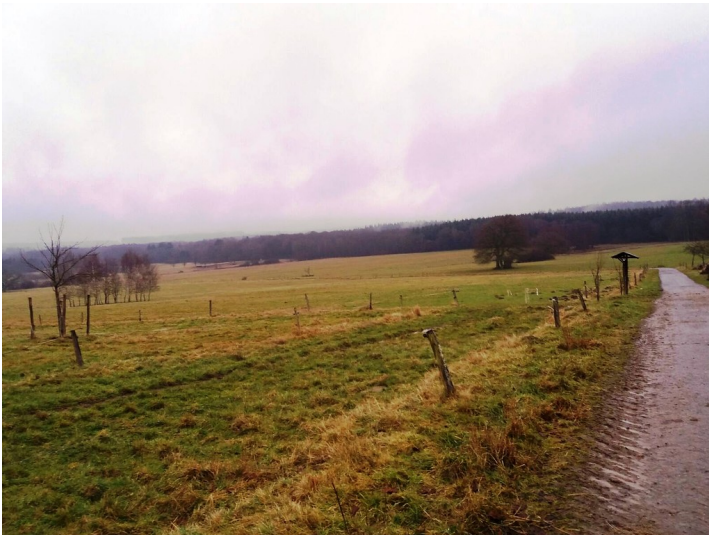
Gelände der Ortswüstung Heidisweiler bei Schöneberg (2017)