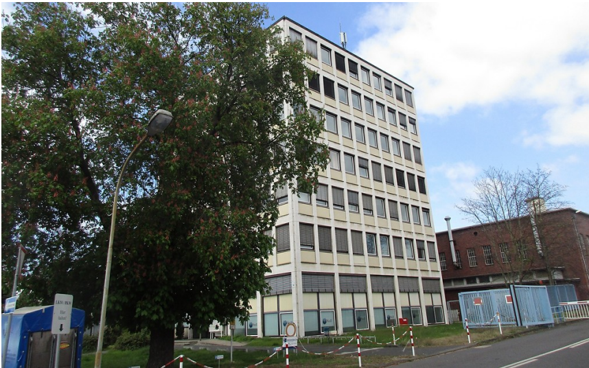
Verwaltungsgebäude am Fabrikgelände der früheren Dynamit Nobel AG in Troisdorf (2017).