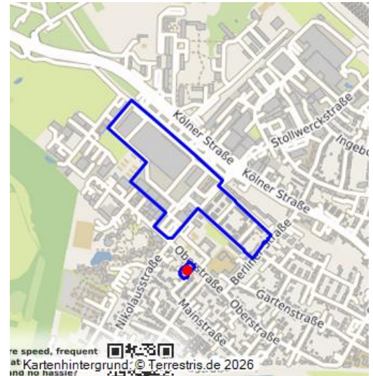
re speed, frequent at und no nassier

Auf dem früheren Industrie- und Firmengelände um die ehemalige Nikolausstraße in Westhoven - zwischen der heutigen Kölner Straße und der André-Citroën-Straße - befand sich von 1918 bis 1928 der Produktionsbetrieb des Fahrzeug- und zeitweise auch Flugzeugbauers Mannesmann-MULAG AG.