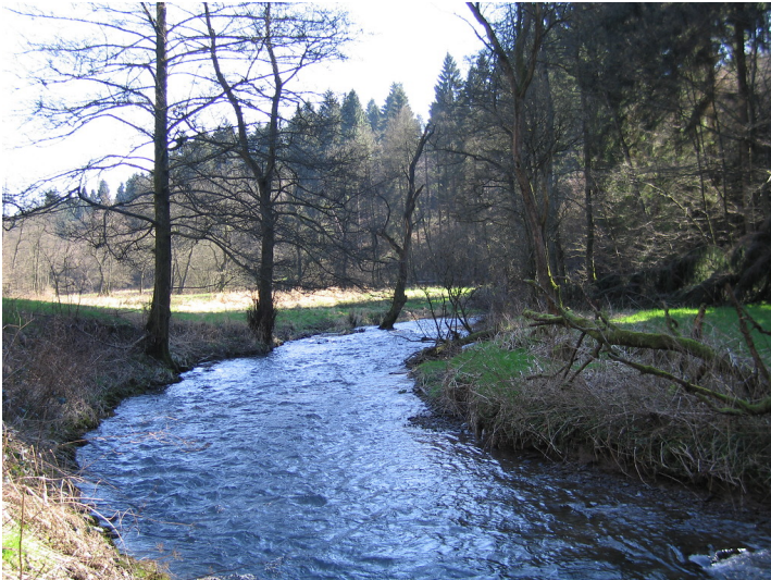
Der Eifgenbach im Einzugsgebiet der Dhünn, Rheinisch-Bergischer Kreis (2007).