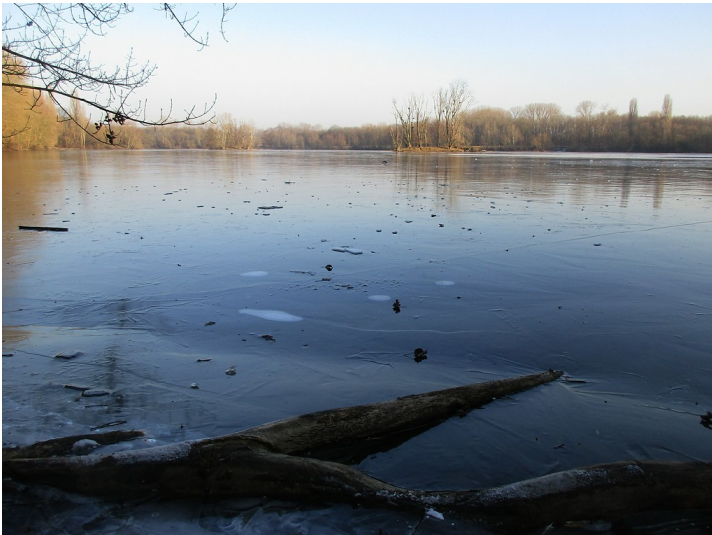
Der zugefrorene Sieglarer See im Naturschutzgebiet "Siegaue und Siegmündung", im Hintergrund die beiden Seeinseln (2017).