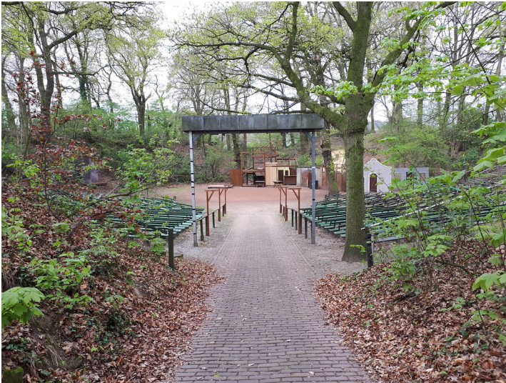
Amphitheater Birten (2017)