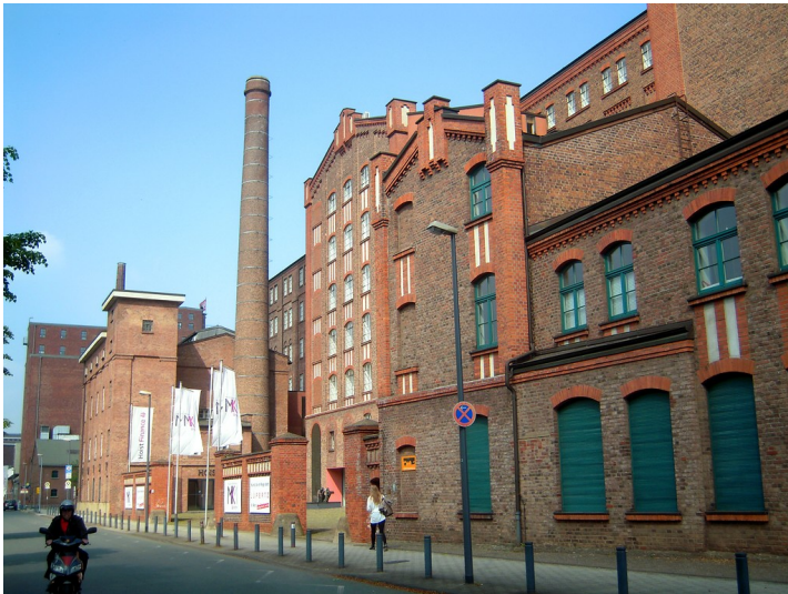
Küppersmühle in Duisburg vom Philosophenweg aus gesehen (2016).