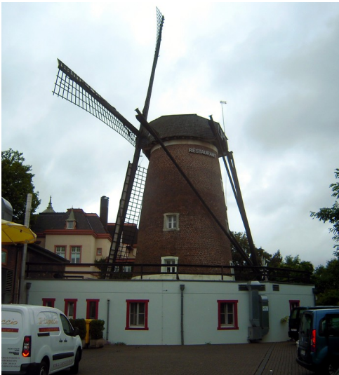
Die Baumeister Windmühle in Oberhausen-Buschhausen von der Hofseite aus gesehen (2016).