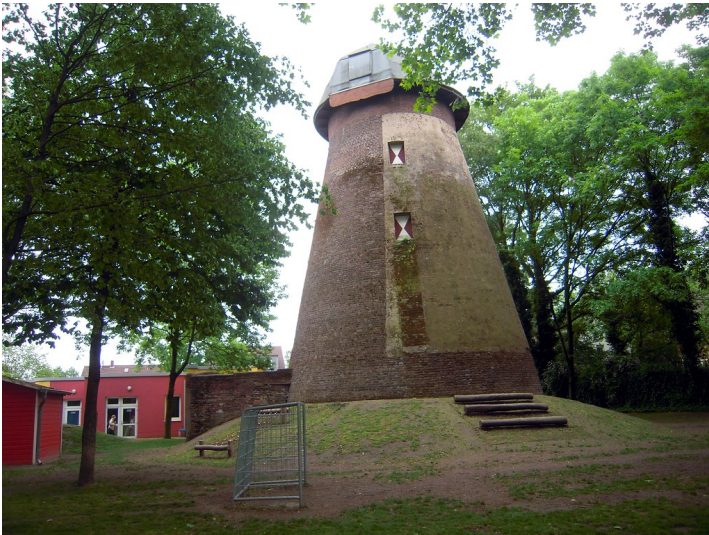
Kiebitzmühle in Duisburg-Hamborn (2016).