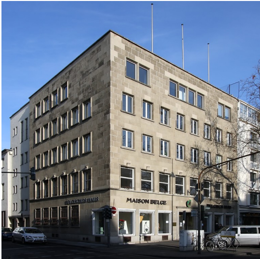
Das Belgische Haus (französisch "Maison Belge") in der Kölner Cäcilienstraße (2009)