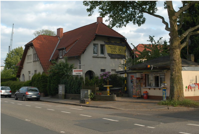
Kiosk in Bövinghausen (2016)