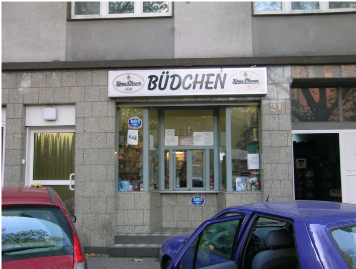
Büdchen in Bruckhausen (2008)