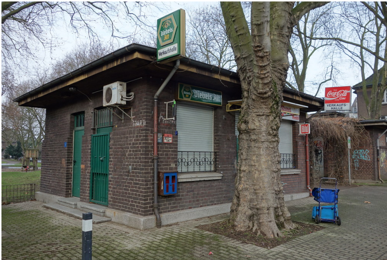
Trinkhalle am Viktoriapark (2016)