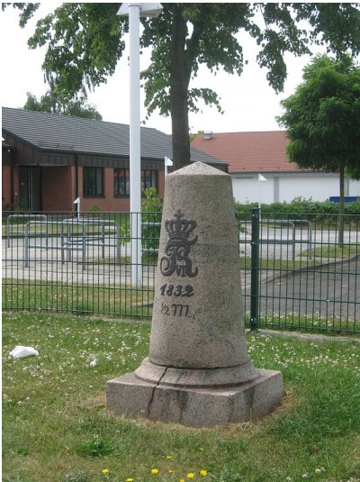
Halbmeilenstein Tungendorf der Chaussee Altona-Kiel (2010)