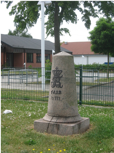
Halbmeilenstein Tungendorf der Chaussee Altona-Kiel (2010)