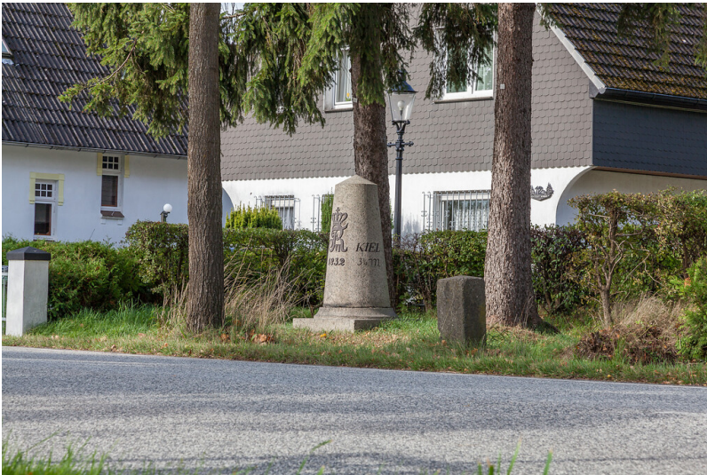
Vollmeilenstein Einfeld der Chaussee Altona-Kiel (2014)