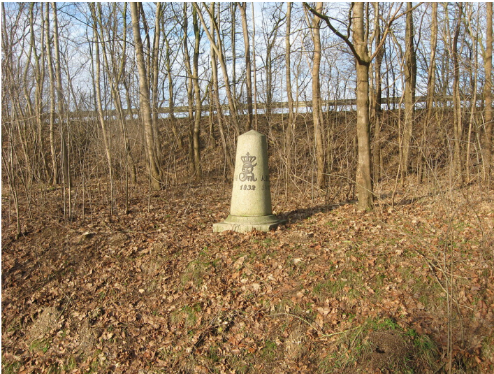
Vollmeilenstein Schmalstede der Chaussee Altona-Kiel (2011)