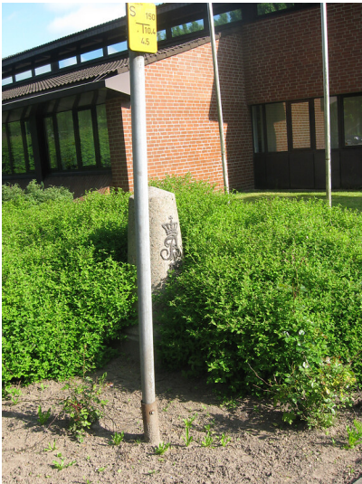
Halbmeilenstein Molfsee der Chaussee Altona-Kiel (2013)