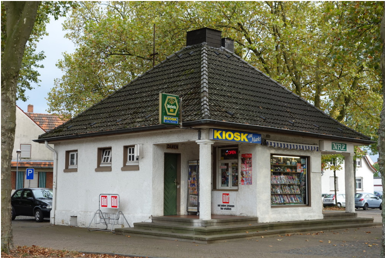
Das steinerne Kiosk hieß auch Milchhäuschen und entstand 1935 (2016)