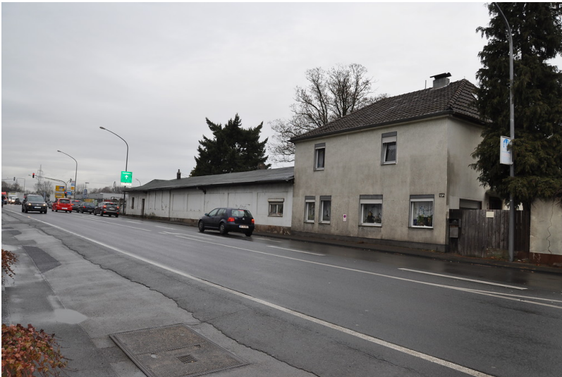
Ehemaliges Schutzhaftlager der SA Am Hochkreuz in Köln-Porz-Eil (2017)