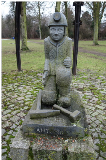
Kumpel Franz-Anton (2016)