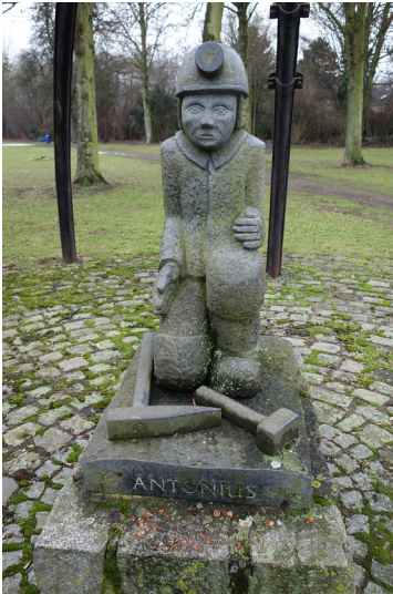
Kumpel Franz-Anton (2016)