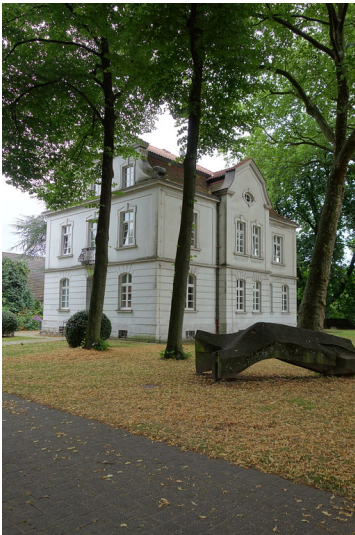
Skulptur Schwerer Stand (2016)