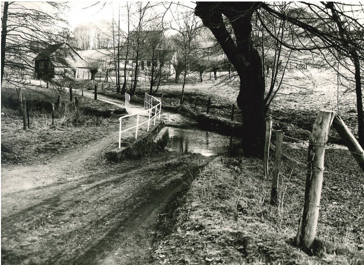
Furt Kirchenfelder Weg (1983)