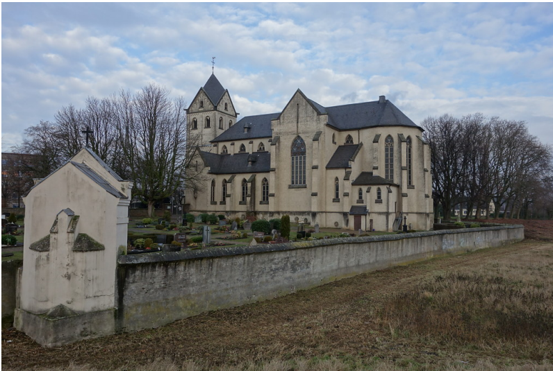
Kirche St. Matthias (2016)