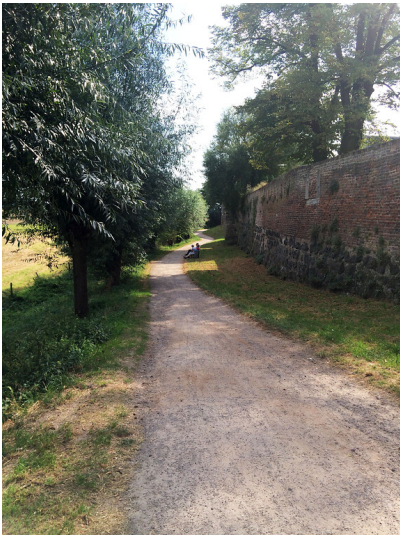
Stadtmauer der Feste Zons (2014)