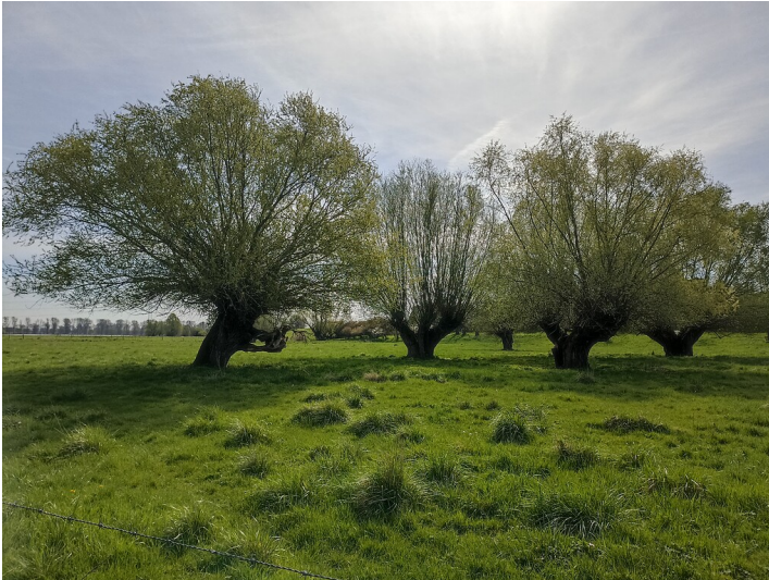
Kopfweiden im Naturschutzgebiet Zonser Grind (2022).