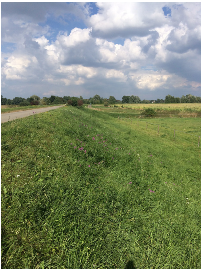
Der Rheindeich auf dem Jakobsweg bei Uedesheim. Im unteren Bereich grenzt eine Weide an den Deich (2014).