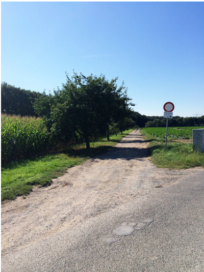
Ein Feldweg bei Ossum mit einzelnen Bäumen am Rand, der zwischen zwei Feldern entlang führt (2014).