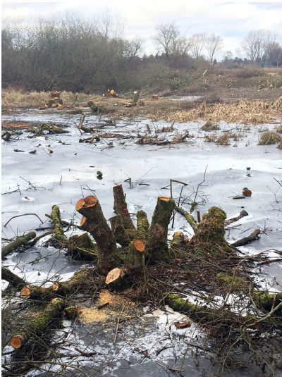
Gehölze nach einem Pflegeschnitt neben dem Jakobsweg im Latumer Bruch (2017).