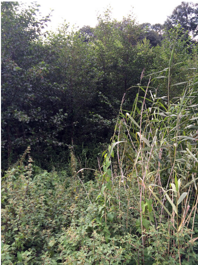
Schilfröhricht neben dem Jakobsweg bei Meerbusch (2014).