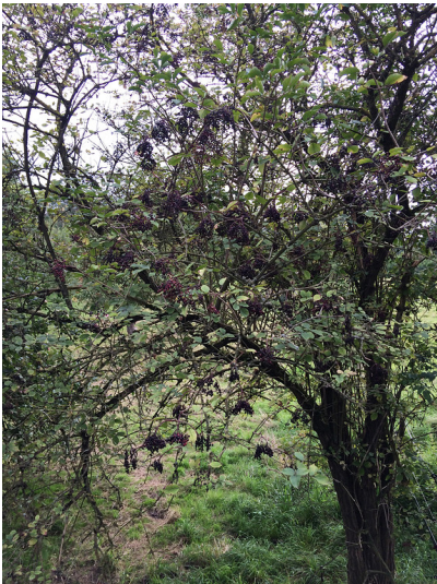
Alte Holundergebüsche am Isselhof (2014). Abgebildet ist ein Holundergebüsch mit Holunderbeeren.