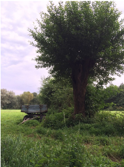
Eine große Kopfweide am Jakobsweg bei Meerbusch-Strümp (2014).