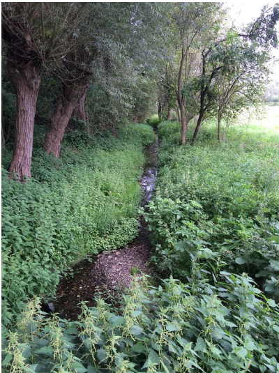
Die Strempe am Jakobsweg bei Strümp, die an einem Wald entlang fließt. Ihr Ufer ist mit Brennnesseln zugewachsen (2014).