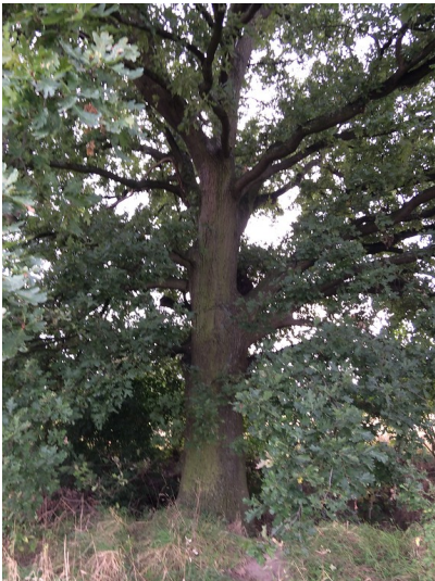
Eine große Eiche am Rand der Straße Bergfeld in Meerbusch-Strümp (2014).