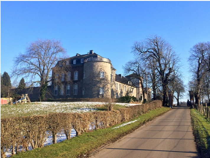
Blick auf den südwestlichen Eckturm des Gut Kalkofen in Aachen (2017)