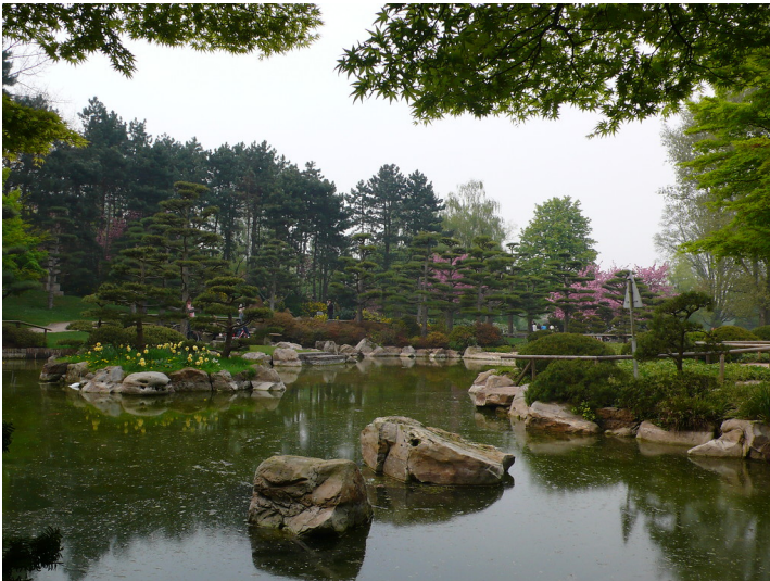
Der Japanische Garten im Nordpark in Düsseldorf (2009).