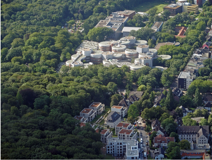
Universität Essen-Duisburg (2021)