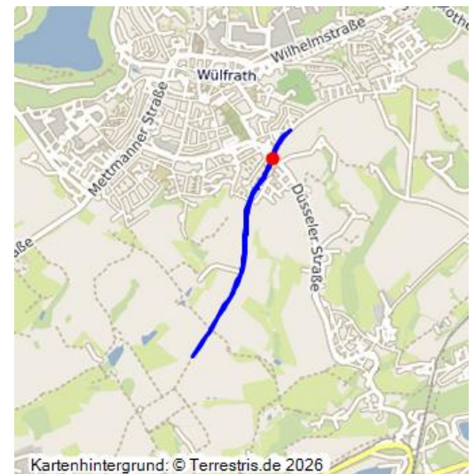
Denkmallistenblatt der Stadt Wülfrath zur Kölnische Landstraße "strata coloniensis"

Die strata coloniensis (Kölnstraße) gehörte im Mittelalter zu den bedeutenden Fernhandelswegen des Niederbergischen Hügellandes. Sie verband die reichsfreie Abtei Werden mit der Handelsmetropole Köln.