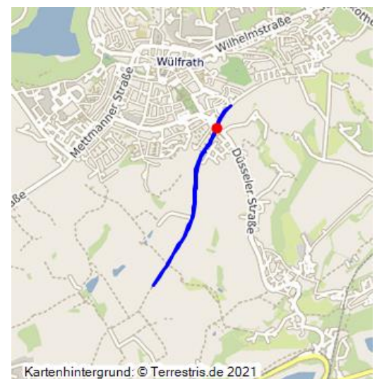
Denkmallistenblatt der Stadt Wülfrath zur Kölnische Landstraße "strata coloniensis"

Die strata coloniensis (Kölnstraße) gehörte im Mittelalter zu den bedeutenden Fernhandelswegen des Niederbergischen Hügellandes. Sie verband die reichsfreie Abtei Werden mit der Handelsmetropole Köln.