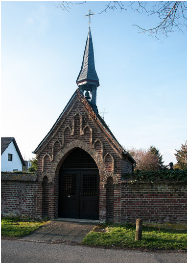
Kapelle St. Anna in Kerpen (2016).