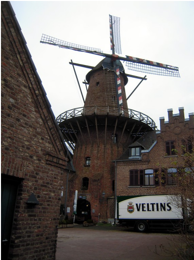
Windmühle am Hanselaerertor in Kalkar (2015)