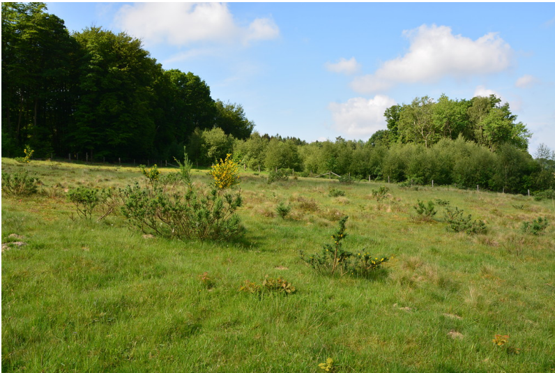
Blick über den Magerrasen bei Reichshof-Buchen (2016)