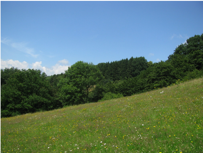
Artenreiche Hangweide in Mittelesbach (2016)