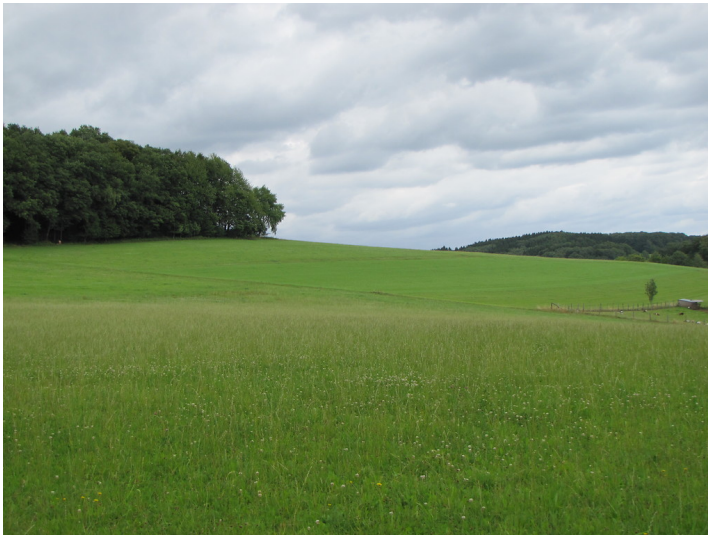
Blick über die Wiesen südwestlich von Waldbröl-Spurkenbach (2015).