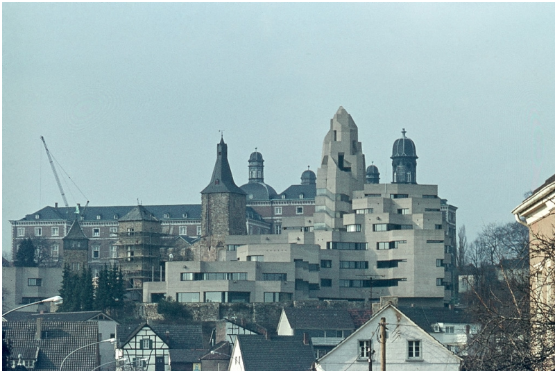
Bergisch Gladbach, Rathaus und Neues Schloss Bensberg