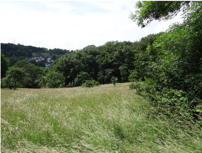
Artenreiche Streuobstwiese bei Dürscheid (2016)