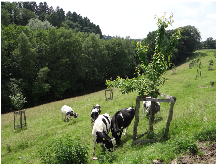
Weidende Jungrinder auf der Streuobstwiese bei Claasmühle (2016)