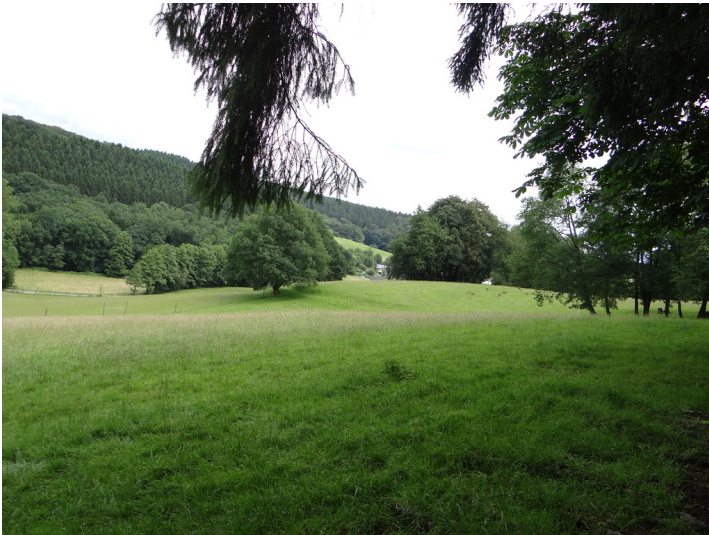
Damwildgehege bei Odenthal-Höffe (2016)