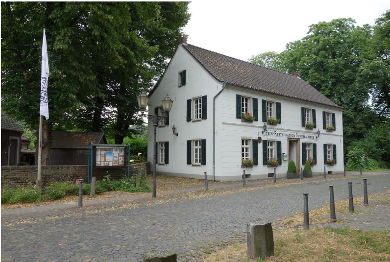
Stammhaus der ehemaligen Privatbrauerei Rheingold (2016)